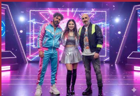
Coro Los Correa. Las Guerreras del K-Bo