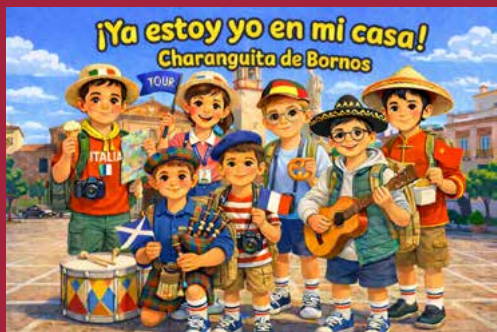
Chirigota infantil Ya estoy yo en mi casa