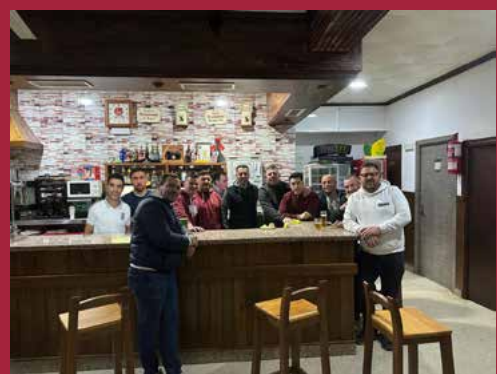
Cuarteto Mientras mas voy al Bar, más dudas tengo