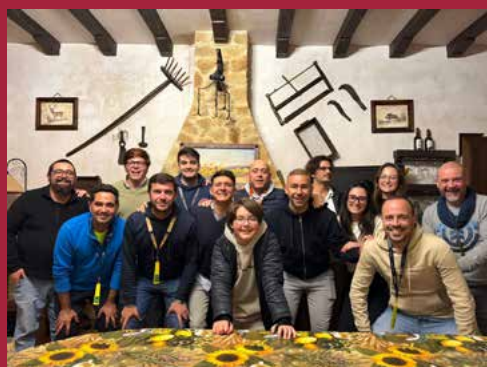
Chirigota Los que fueron al Festival del Lago Rock...y se quedaron cogíos der tó