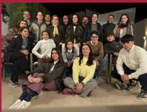
Chirigota Familiar El Doctor Carpa, la Doctora Bla-Blá y los Barbos indomables