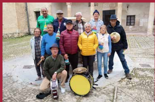
Murga Mayores Activos