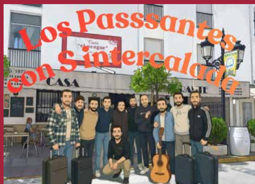
Chirigota Los Passantes con Sintercalada