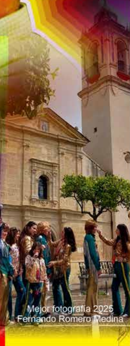
Mejor fotograf3a 2025 Fernando Romero Medina