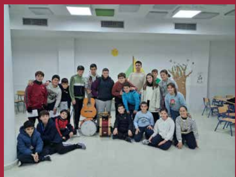
Chirigota infantil ¡Alexa dame el bastón!