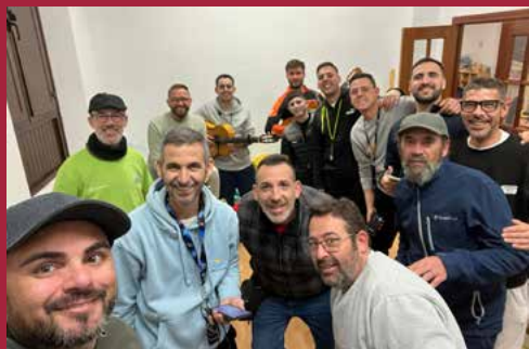
Chirigota ¡Quillo! ¿Tú tanterao?