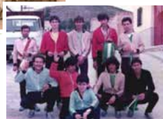
Naranjito y su balón y los qué armán el follón. Año 1989