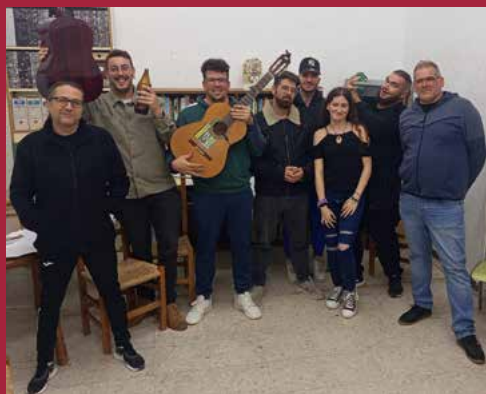
Chirigota FBI (Federación Bornicha de Investigación)